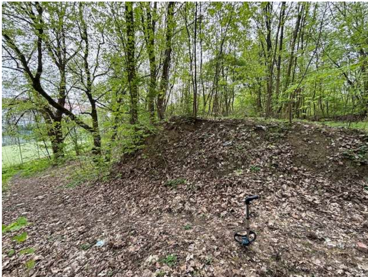
Fot. 7 Przebieg ciągu spacerowego po trasie istniejącego przedeptu - widok w kierunku ul. Paproci

Budowa ciągu spacerowego, obiektów małej architektury w miejscu publicznym wraz z oświetleniem na działkach ewid. nr 8/2 i 10/2 obręb 3022 w Szczecinie.