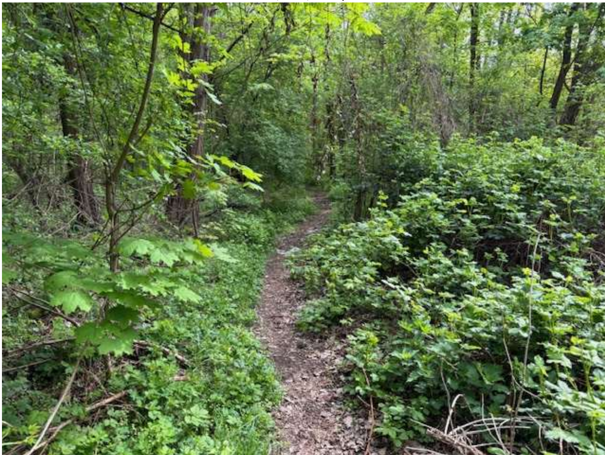
Fot. 3 Przebieg ciągu spacerowego po trasie istniejącego przedeptu - widok w kierunku ul. Paproci