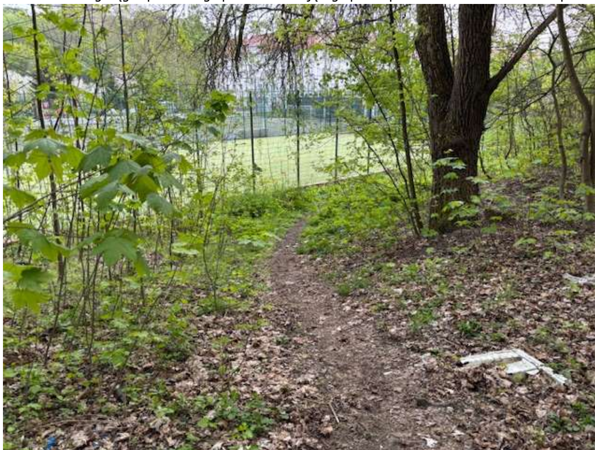
Fot. 8 Przebieg ciągu spacerowego po trasie istniejącego przedeptu - widok w kierunku ul. Paproci