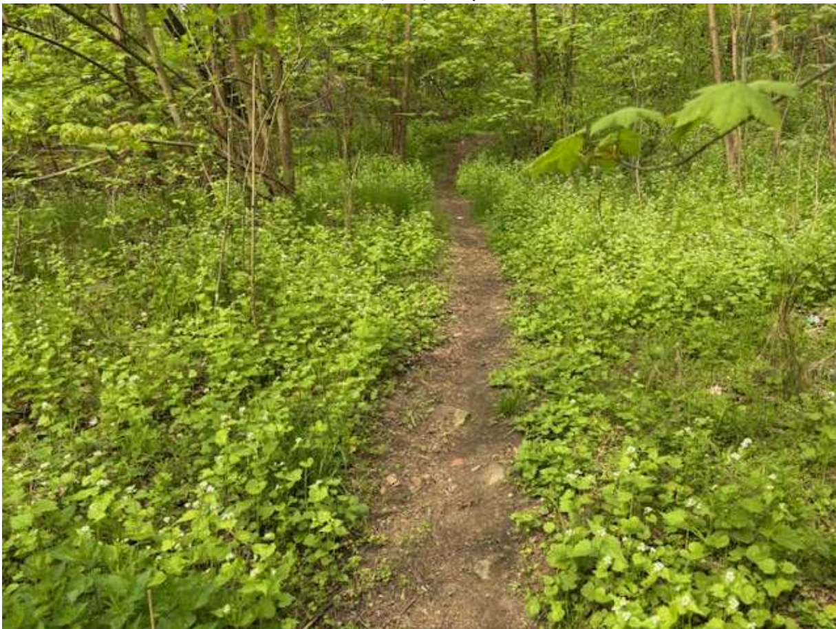
Fot. 5 Przebieg ciągu spacerowego po trasie istniejącego przebiegu - widok w kierunku ul. Widuchowskiej