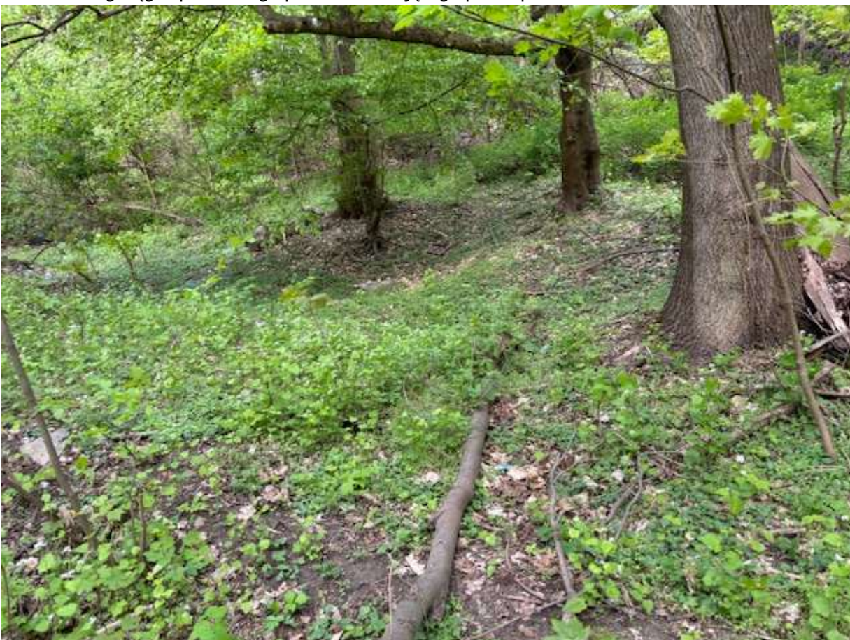
Fot. 6 Przebieg ciągu spacerowego po trasie istniejącego przebiegu - widok w kierunku ul. Widuchowskiej