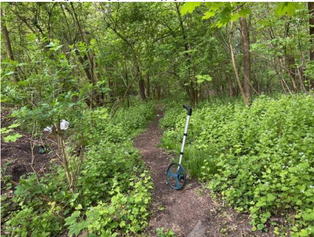
Fot. 4 Przebieg ciągu spacerowego po trasie istniejącego przedeptu - widok w kierunku ul. Widuchowskiej