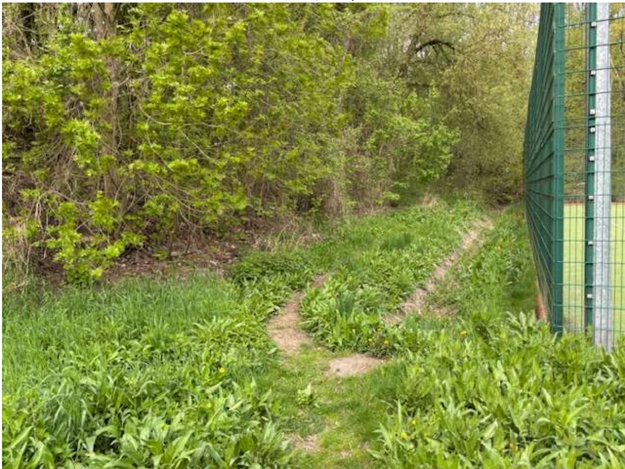
Fot. 9 Przebieg ciągu spacerowego po trasie istniejącego przeдеptu - widok w kierunku ul. Widuchowskiej