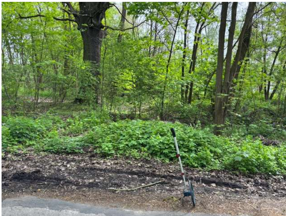
Fot.1 Początek ciągu spacerowego – widok od strony ul. Widuchowskiej