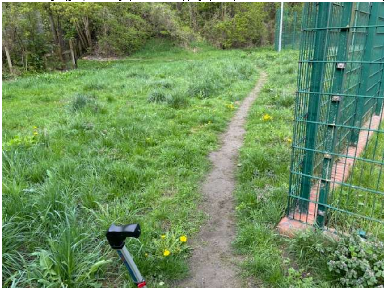
Fot. 10 Przebieg ciągu spacerowego po trasie istniejącego przeдеptu - widok w kierunku ul. Widuchowskiej